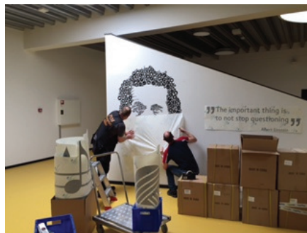
Einstein er ved ankomme til vores Scienceområde